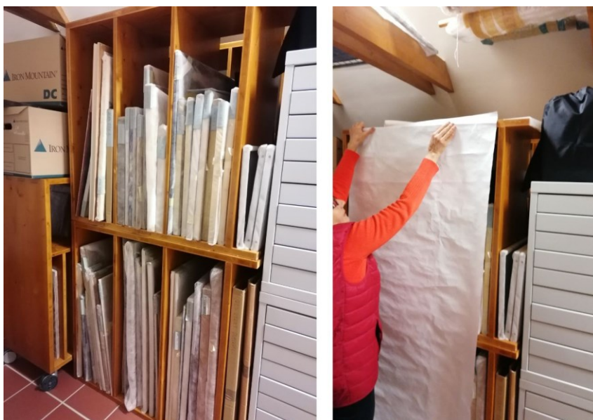
1. Tyvek fólia méretezése a festménytároló szekrényre

A képzőművészeti gyűjtemény részeként számos keretezett festménnyel és fa nyomódúccal rendelkezik a múzeum. Az 59 db nyomódúcot és a 44 db festményt már korábban a por ellen részben fémszekrényben, részben textillel lefedve, egymástól ugyan elválasztva, de a raktár padlóján tároltuk. Az előző évben függőleges osztású festménytárolót alakítottunk ki meglévő tárolóbútorainkból a padlástér koncepciózus átalakítása nyomán. A szekrények kétoldalról nyitottak, ezért egy tépőzárral és cipzárral zárható védőhuzatot készült a műtárgyak por elleni védelmére. A huzat megvásárlásra jelen pályázat nyújtott lehetőséget. A Tyvek 1442 / 1443R finom, nagy sűrűségű, polietilén szálakból álló, nem szövött, textil szerű, átlátszatlan anyag, mely tulajdonságai ideális műtárgytároló, illetve csomagolóanyaggá teszik.