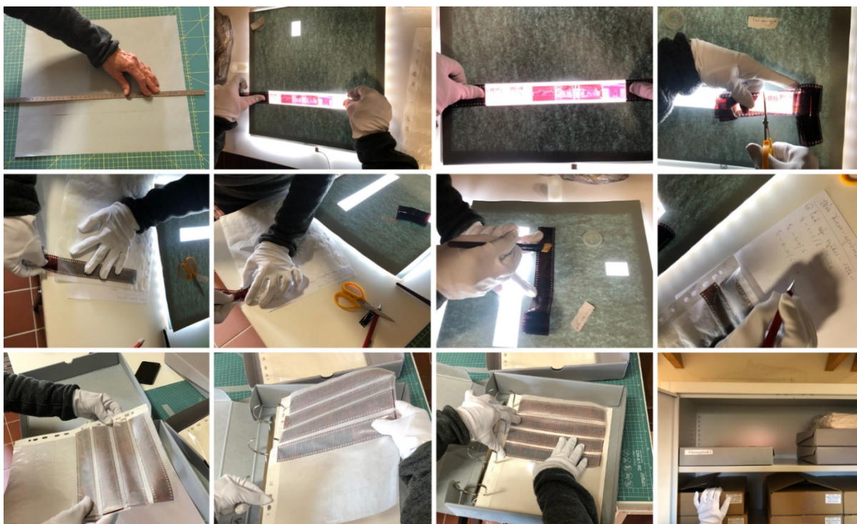
4. Fotónegatívek feldolgozása és tárolása a beszerzett csomagolóanyagok és tároló dobozok felhasználásával

A gyűjtemény jelenleg hozzávetőleg 2300 db keretezett diából, 250 db különböző méretű fekete-fehér és színes fényképből és 4500 db fekete-fehér és színes negatív filmkockából áll. A végső cél a fotógyűjtemény teljes digitalizálása, egy kutatható adatbázis létrehozása, ami mentesíti az eredeti műtárgyakat a rendszeres mozgatástól. A mostani pályázat révén műtárgybarát, prémium minőségű állományvédelmi célokat szolgáló tároló- és