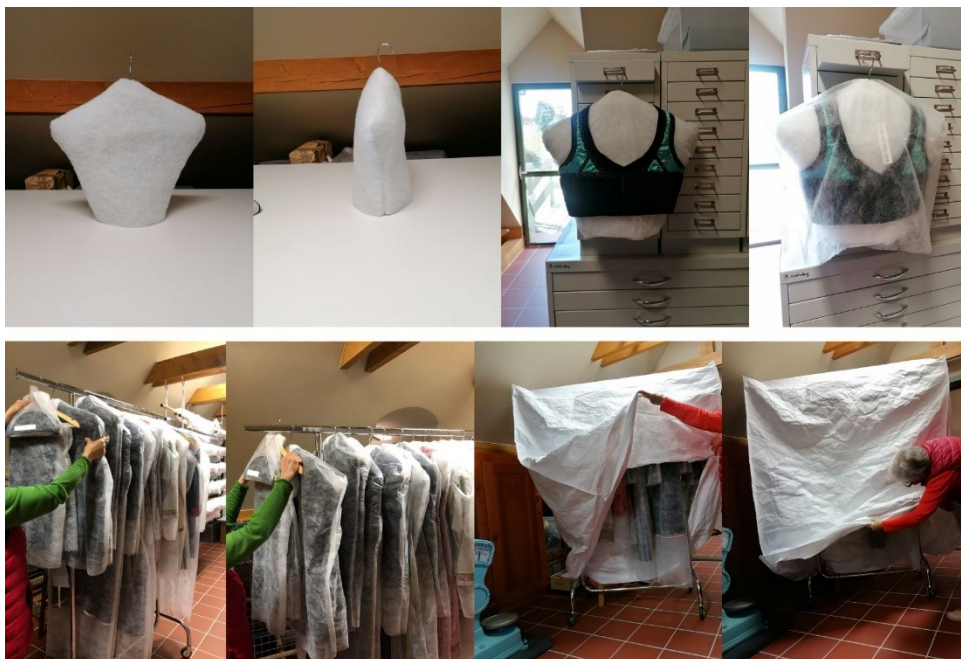
3. Viseletek tárolása tömővlies-zel és védőfóliával ellátott vállfán és állványon. Az állványt végül Tyvek fóliából varrt huzattal borítottunk be